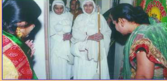
પૂજ્યશ્રીને આવકારતા પરિવારજનો