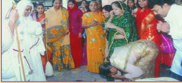
પૂજ્યશ્રીનું ગઠુંલીથી સામૈયુ