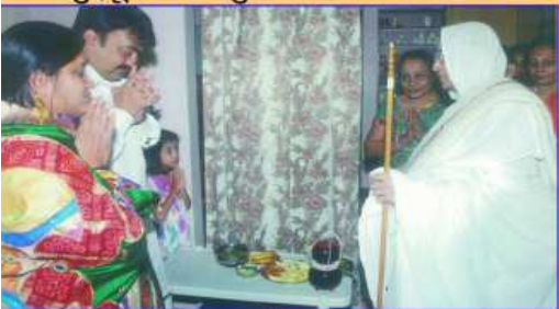
પૂજ્યશ્રીને વહોરાવવાનો લાભ લેતો છેડા પરિવાર