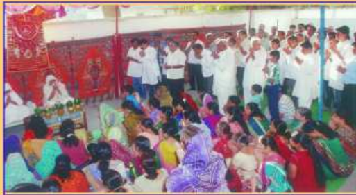
પૂજ્યશ્રી માંગલિક ફરમાવે છે