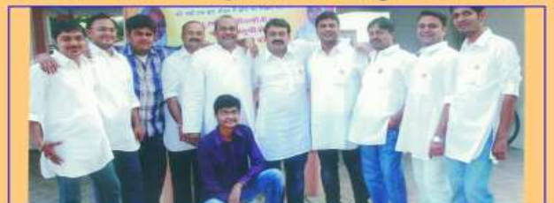
શ્રી કચ્છકેસરી યુવક મંડળની ટીમ