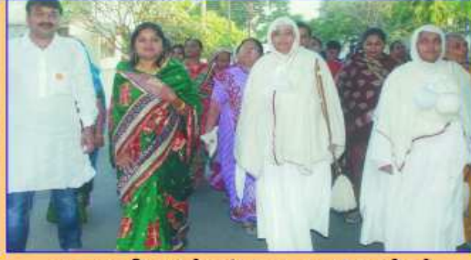
પૂજ્યશ્રી સાથે સંઘના ભાઈ-બહેનો