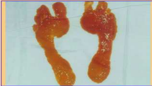
પૂજ્યશ્રીના પાવન પગલાં