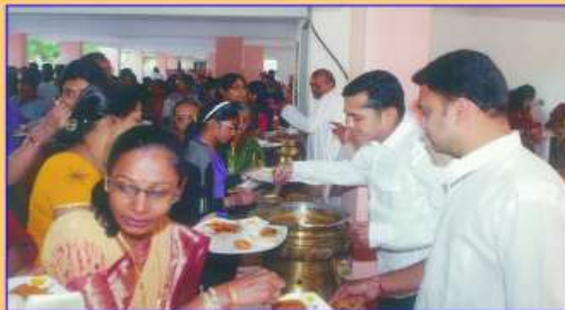
સંઘનવકારશ્રીનો લાભ લેતા જલગામવાસીઓ