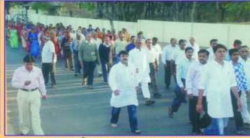
પરિવર્તન પ્રસંગે સંઘ શોભા યાત્રા