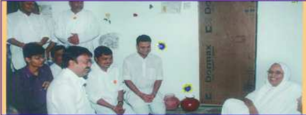
પૂજ્યશ્રી સાથે સંઘના ભાવિકો