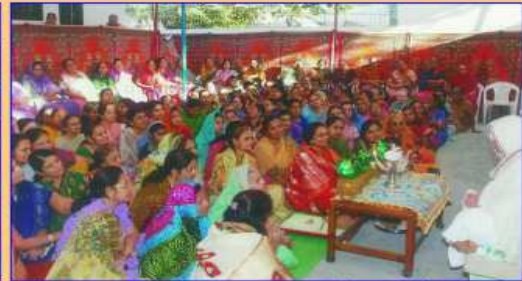
પૂજ્યશ્રીનું વ્યાખ્યાન સાંભળતો સંઘ